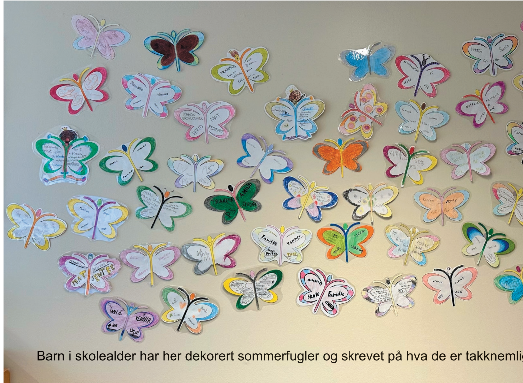
Barn i skolealder har her dekorert sommerfugler og skrevet på hva de er takknemlige for.

- Takknemlig for å bo i Vennesla, høre til i Norkirken. Sover godt om natta, har mat å spise, gode venner, har barn og barnebarn. Ikke minst, har fred med Gud og en evighet i vente.