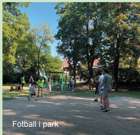
Fotball i park

Jeg syns misjonsturen var både lærerik og godt planlagt. Når man reiser på en misjonstur så kommer man ofte