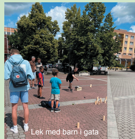
Lek med barn i gata

Det var gøy å være med å spre Guds ord og kjærlighet på andre måter enn det jeg er vant til. For eksempel fikk vi prøvd oss på gateevangelisering, noe som var langt utenfor min komfortsone, men som det var veldig gøy å få prøve. På misjonstur føler jeg at jeg for utfordret meg selv og min komfortsone