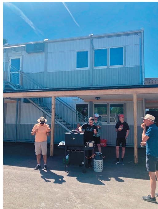
Fra forsommerens utegudstjeneste i skolegården til Oasen, med grilling etterpå.