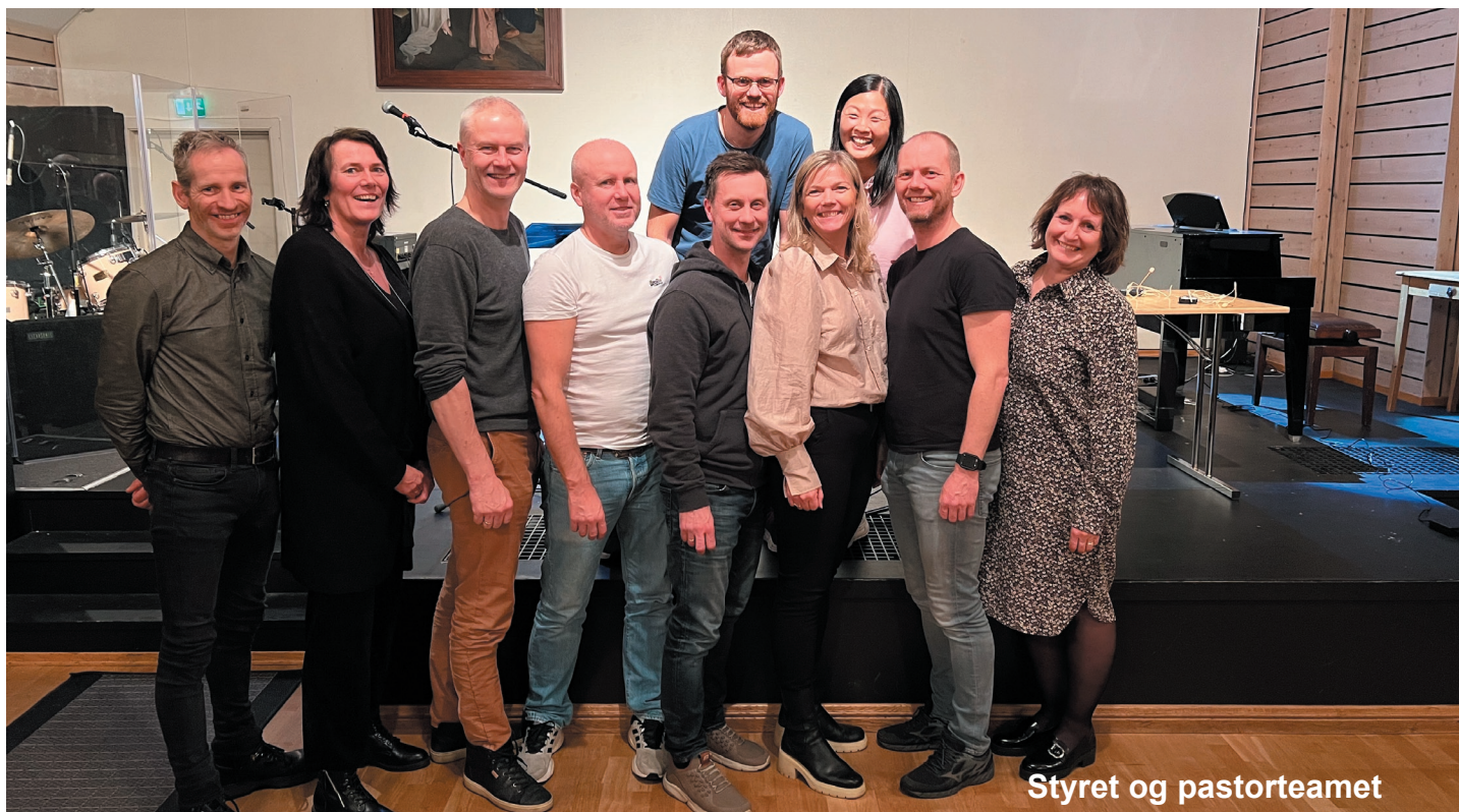
Styret og pastorteamet

PS: Du kan lese mer om givertjeneste på nettsidene våre. Finn menyknappen og deretter “gi”.