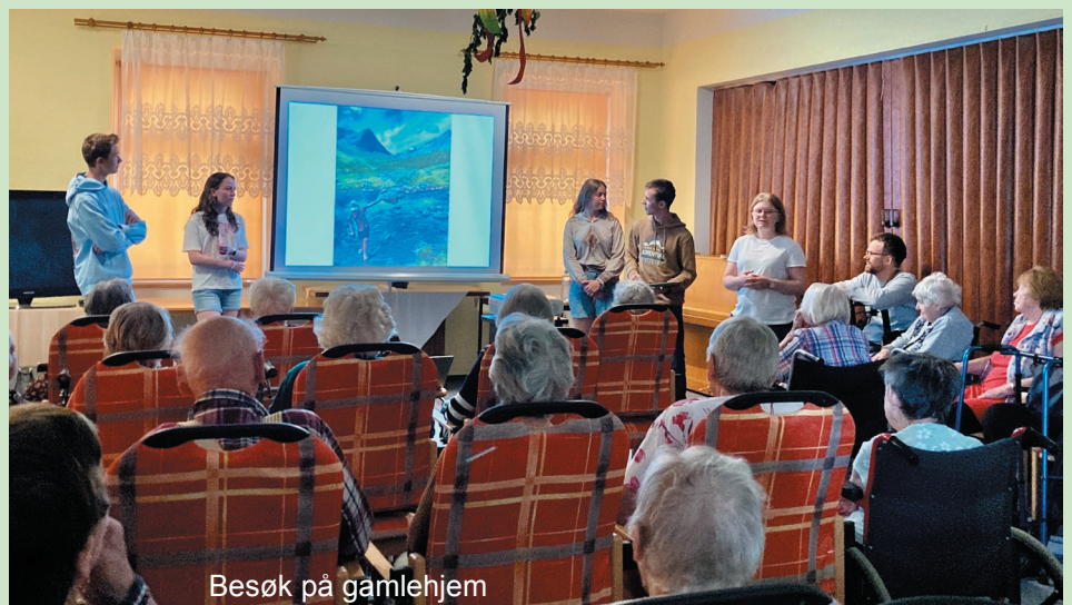
Besøk på gamlehjem

Et av mine flotteste minner fra turen var da vi var på gateevangelisering i nabobyen. Vi delte oss i grupper på 2-3 stykker, nordmenn og tsjekkere, og gikk så ut i byen for å se hva Gud ville gjøre. Jeg og en tsjekkisk gutt lurte på hvilken vei vi skulle gå. Vi snurret en flaske på bakken og gikk den veien flasken pekte. Etter 50 meter passerte vi to menn som vi hilste på. Vi stoppet opp og så at den ene mannen kom tilbake mot oss. Han spurte om vi hadde penger. Jeg sa at vi dessverre ikke hadde det, men vi kunne be for han hvis han ville. Den unge tsjekkeren oversatte og jeg ba en enkel bønn. Tårene begynte å trille på mannen og han fortalte sin historie. Han var rusavhengig, men ville komme ut av det. Kvelden før hadde han bedt til Gud om å gi han et tegn. Så møtte han oss, og han tok det som