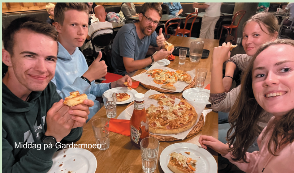
Middag på Gardermoen

et tegn på at Gud levde. Nå ville han fortsette å jobbe for å bli rusfri. Det var snørr, tårer og klemmer, og vi fikk be enda mer sammen med han. Så gikk vi videre i byen, men da skjedde det ikke så mye. Fantastisk, men også merkelig å være med på det Gud gjør.