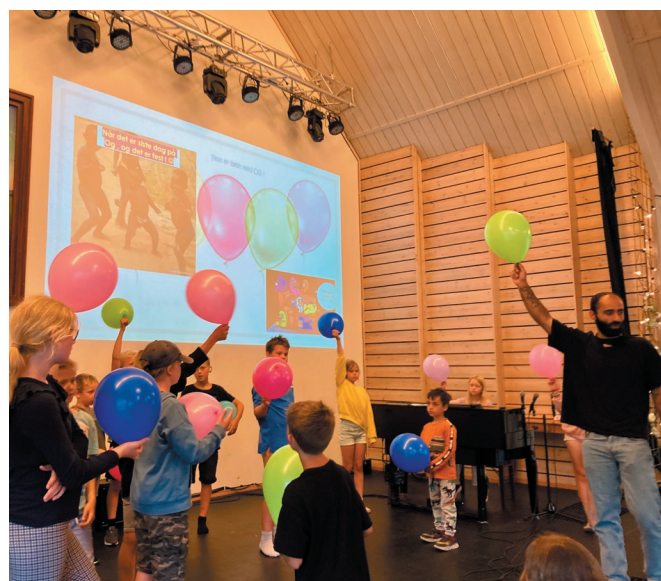
Glimt fra Onsdagsgjengen .