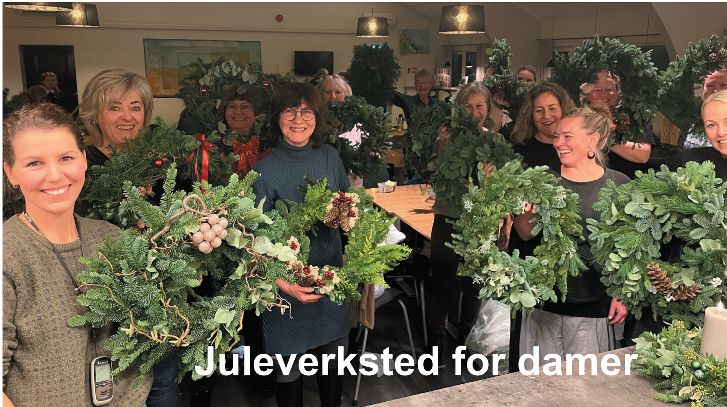
Juleverksted for damer

Vi ønsker dere alle en velsignet julehøytid!