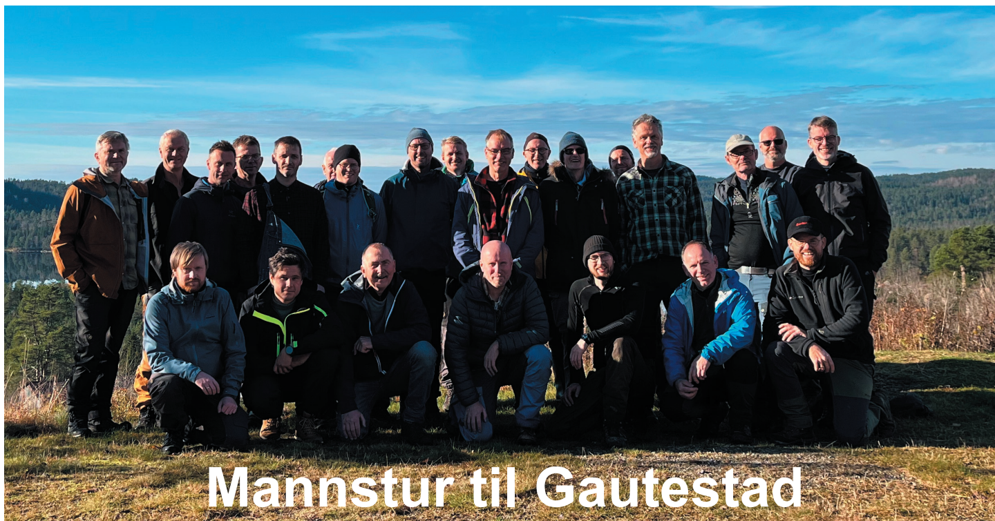
Mannstur til Gautestad

Vi ønsker dere alle en velsignet julehøytid!